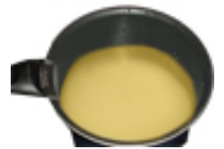
Eau de cuisson